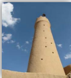
شکل ۷: مناره مسجد فهرج

این مسجد در 22 کیلومتری یزد در قریه‌ای به نام فهرج، سر راه قدیم یزد به کرمان است و تک مناره گلی آن از فاصله دور دیده می‌شود. این بنا در بخش قدیمی روستا و در سمت جنوب شرقی فضای مربع شکل کوچکی که به "حسینیه" معروف می‌باشد، قرار گرفته است. (شکل ۷)