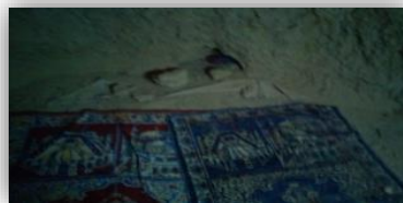
شکل ۴: چله‌خانه

مدیتیشن و دعا به این فضا رجوع می‌کنند. پوشش این فضاها مانند سایر فضاهای مسجد تخت و تیرپوش است، با این تفاوت که ارتفاع این قسمت از ساختمان کمی بالاتر نسبت به فضاهای دیگر است.