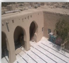
شکل ۳: نمای شبستان خواب زمستانی

۲-۲-۳- شبستان زمستانی شمالی در ضلع شمالی مسجد، این شبستان قرار دارد (شکل ۳). این فضا شامل دو دهانه و پنج ستون است که در یک ردیف بین دهانه‌های شبستان قرار گرفته‌اند. پوشش این فضا مانند سایر فضاهای مسجد با تیرپوش و تخت اجرا شده است. طاق‌ها بیضی شکل هستند. محراب در جهت قبله و در مرکز قسمت جنوبی شبستان قرار دارد. در ضلع شرقی یک طاق‌نمای عمیق و در ضلع غربی محراب دو طاق‌نمای عمیق ایجاد شده که قرآن و سجاده و چیزهای دیگر بر روی آن قرار گرفته است. منبر کوچک آجری با دو پله در داخل محراب اجرا شده است.