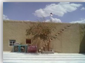
شکل ۵: نمای صحن مرکزی مسجد

صحن در مرکز مسجد قرار دارد که اطراف آن شبستان‌هایی ساخته شده است. گویا کف اصلی صحن بسیار پایین‌تر از سطح کف موجود قرار داشته است. پلکانی در ضلع شمالی صحن وجود دارد که دسترسی به سقف بنا را تسهیل می‌کند (شکل ۵).