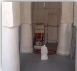
شکل ۶: محراب و منبر در شبستان زمستانی

این مسجد دارای فرمی کاملاً ساده و بی‌آلایش است اما مانند سایر مساجد ایران اسلامی عناصر معماری زیبایی از جمله ۲ عدد محراب (در شبستان جنوبی و زمستانی) و منبر (در گوشه غربی محراب شبستان زمستانی) را دارد. (شکل ۶)