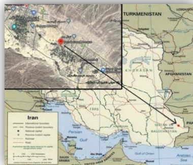
شکل ۱: موقعیت مسجد در جنوب شرقی ایران

مسجد دزک در ۳ کیلومتری شرق شهرستان سراوان در استان سیستان و بلوچستان در جنوب شرقی ایران قرار دارد. (شکل ۱)