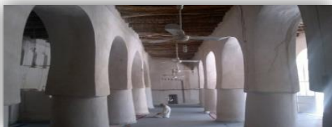
شکل ۲: نمای شبستان جنوبی

نیز استفاده شده است (شکل ۲). پوشش طاق بین ستون‌ها که فقط از شرق به غرب اجرا می‌شود، بیشتر بیز بوده و گاه طاق‌های تیزهدار بین آن‌ها مشاهده می‌شود که به این دلیل است که طاق‌های آنها در دوره‌های مختلف تعمیر شده است. محراب تقریباً در مرکز شبستان قرار دارد و در دو طرف آن دو طاق نوک تیز به عمق تقریبی ۱۸ تا ۲۰ سانتی متر قرار دارد.